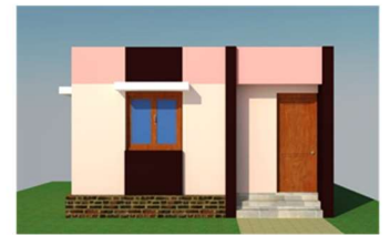
प्रस्तावित घरकुल - पर्याय २

तरी आपल्या कार्यक्षेत्रातील प्रधानमंत्री आवास योजना-ग्रामीण, रमाई आवास योजना, शबरी आवास योजना, पारधी आवास योजना आणि आदिम आवास योजना या सर्व ग्रामीण गृहनिर्माण योजनांतर्गत बांधण्यात आलेली घरकुले एकसमान दिसावीत, या उद्देशाने वर दिलेल्या आराखड्याप्रमाणे रंगसंगतीचा वापर करता येऊ शकेल. सदर रंगसंगती वापरणे हे लाभार्थ्यांस बंधनकारक नसून रंगसंगतीचा वापर करणे बाबतचा अंतिम निर्णय हा लाभार्थ्यांचा राहिल.