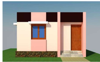
प्रस्तावित घरकुल - पर्याय १