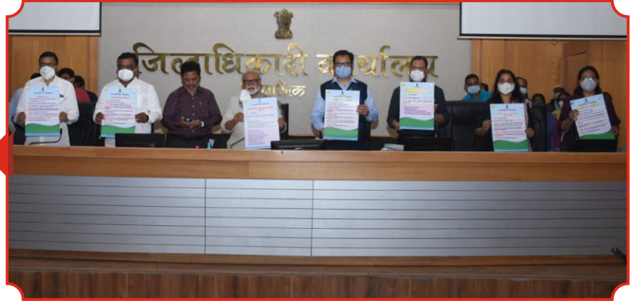
महा आवास अभियान २.० जिल्हास्तरीय कार्यशाळे प्रसंगी नाशिक येथे मा. मंत्री, अन्न, नागरी पुरवठा व ग्राहक संरक्षण तथा नाशिक जिल्ह्याचे पालकमंत्री श्री. छगन भुजबळ