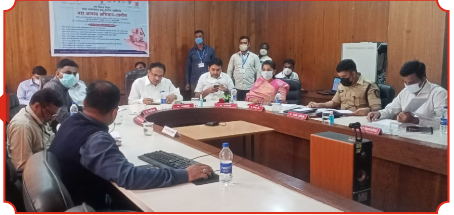
महा आवास अभियान २.० जिल्हास्तरीय कार्यशाळे प्रसंगी सांगली येथे मा. मंत्री, जलसंपदा व लाभक्षेत्र विकास तथा सांगली जिल्ह्याचे पालकमंत्री श्री. जयंत पाटील