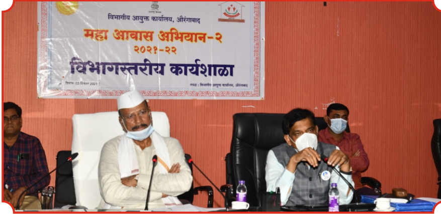
महा आवास अभियान २.० विभागस्तरीय कार्यशाळे प्रसंगी औरंगाबाद येथे मा.राज्यमंत्री, ग्रामविकास व महसूल श्री.अब्दुल सत्तार