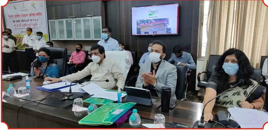
महा आवास अभियान २.० जिल्हास्तरीय कार्यशाळे प्रसंगी नांदेड येथे मा. मंत्री, सार्वजनिक बांधकाम तथा नांदेड जिल्ह्याचे पालकमंत्री श्री. अशोक चव्हाण